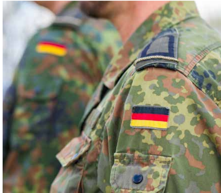
Alman ordusunda yahudi hahamlar bu sene göreve başlayacak.

300 Yahudi asıllı askerin bulunduğu Alman ordusunda 48 kadar haham görev yapacak.