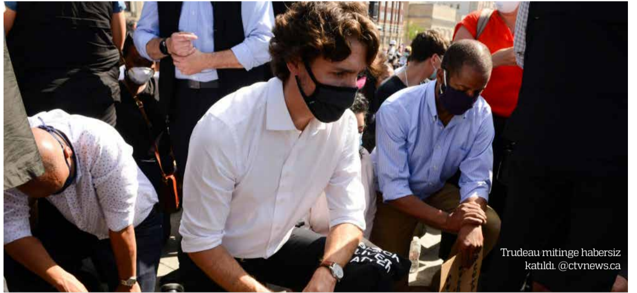
Trudeau mitingine habersiz katıldı.

İkinci İslam Halifesi Hazreti Ömer'in torunlardan Ömer bin Abdulaziz'in mezarının içinin boş olduğuna dair görüntüler Suriye'deki Esed rejimine bağlı sosyal medya sayfalarına yansımıştı. Geçtiğimiz hafta boşaltılan kabir görüntülerine göre Ömer bin Abdulaziz'in naaşının akibeti de bilinmiyor.