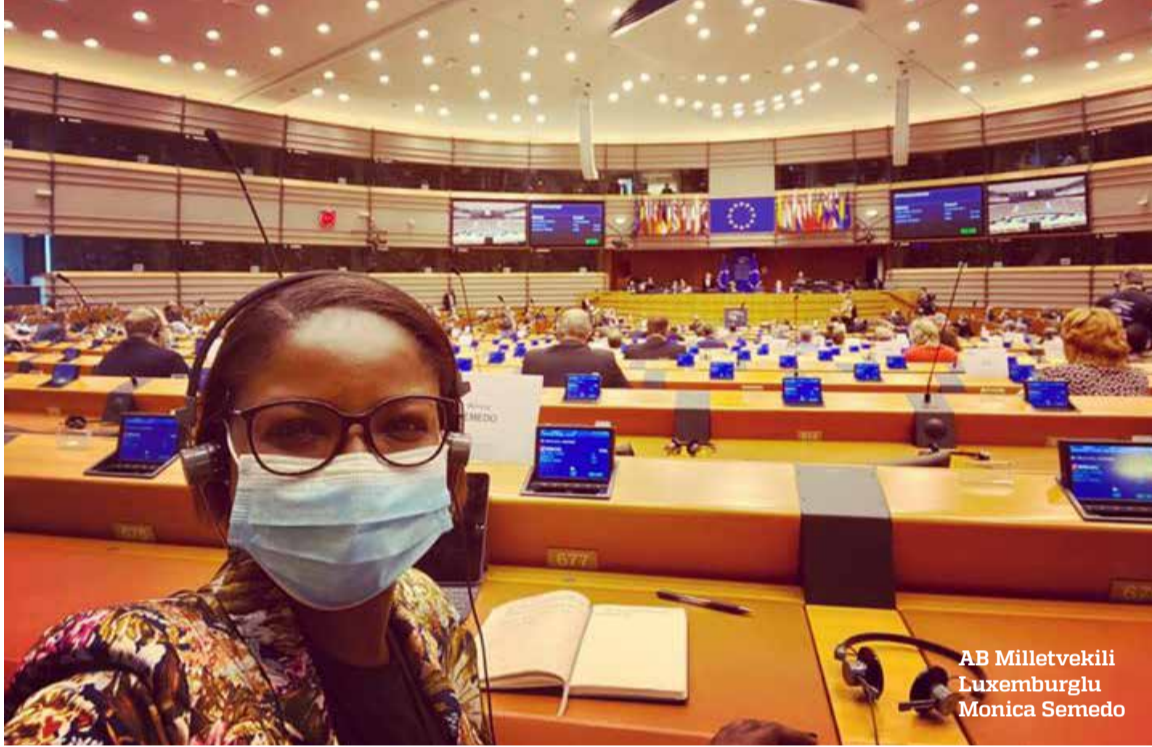
AB Milletvekili Luxemburglu Monica Semedo

Yeşiller ve Sosyal Demokrat gruba bağlı 118 milletvekili AB Komisyonu başkanına bir mektup göndererek, AB’nin ırkçılığa karşı güçlü ve kararlı bir duruş sergilemesini istedi.