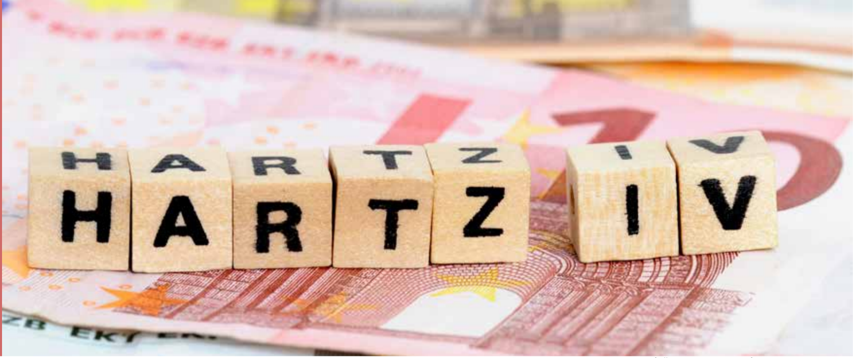
Hartz IV şartları yaşanan koronavirüs salgını nedeniyle kolaylaştırıldı.

Almanya'da Hartz IV olarak bilinen sosyal yardımlar için şartlar korona krizi dönemi için kolaylaştırıldı. Vatandaşa geçici olarak daha kolay ve hızlı bir şekilde yardım sağlanacak.