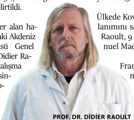
PROF. DR. DIDIER RAOULT

Fransız basınında yer alan haberlerde, Marsilya'daki Akdeniz Enfeksiyon Enstitüsü Genel Direktörü Prof. Dr. Didier Raoult'un yaptığı bir çalışma sonucu sıtma tedavisinde başvuru klorokin virüsü taşıyan 1061 kişide kullanıldığı kaydedildi.