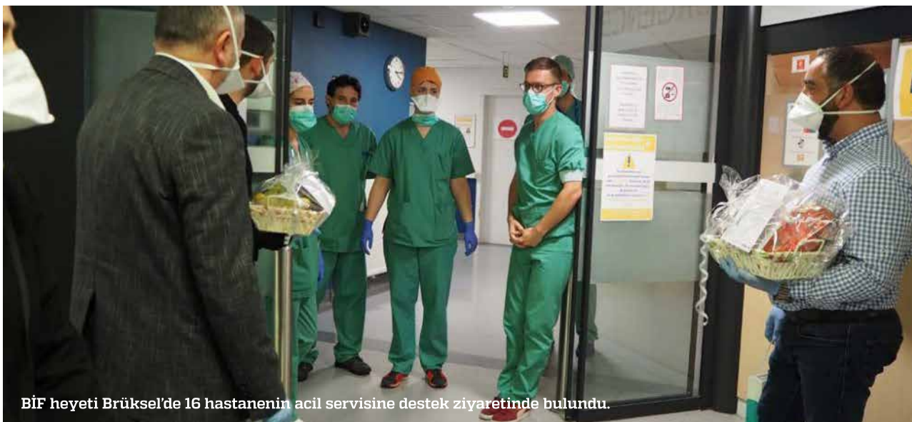
BİF heyeti Brüksel'de 16 hastanenin acil servisine destek ziyaretinde bulundu.

IGMG tarafından başlatılan aksiyonda, Avrupa'da hızla yayılan koronavirüs salgınına karşı mücadele eden hastane personellerine destek ziyaretlerinde bulunuluyor.