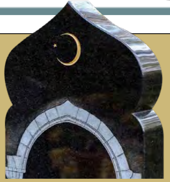
Fransa'da CFCM Cumhurbaşkanı Macron'a mektup yazarak Müslüman mezarlığı sayısının artırılmasını talep etti.

Mektupta belediyelere ait birçok mezarlıkta