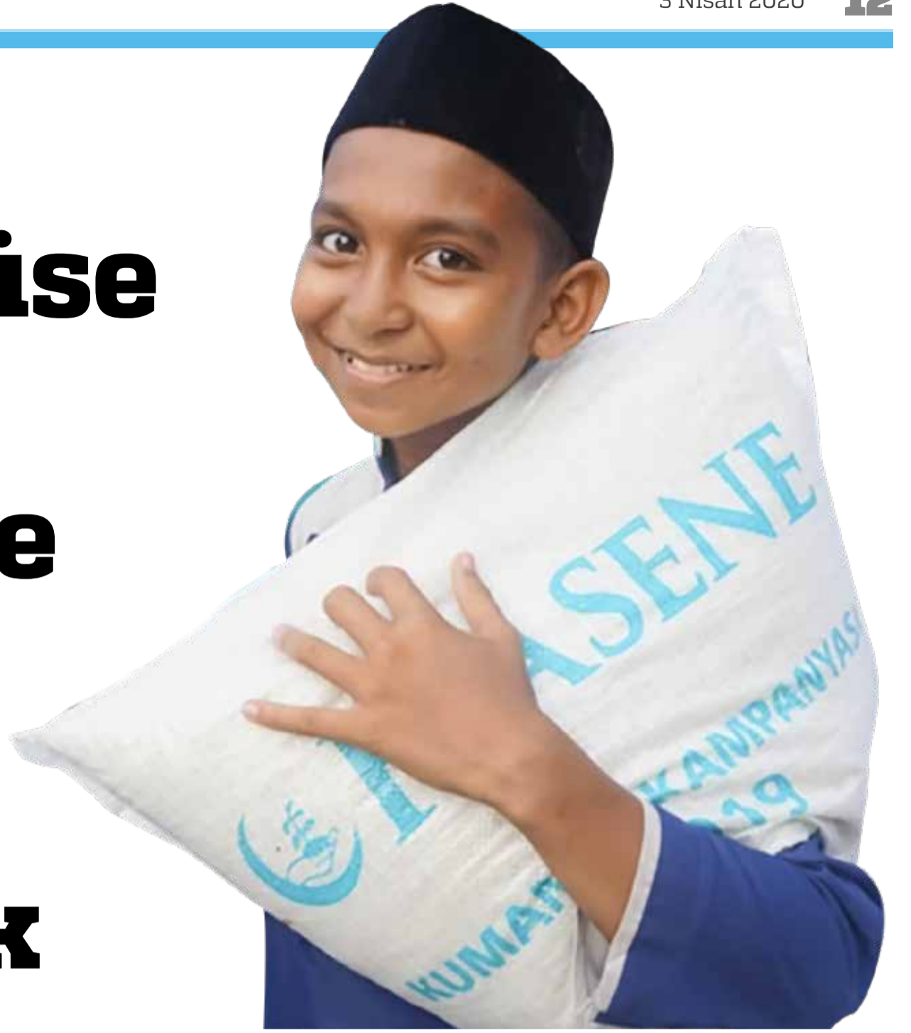
Hasene, dünyayı saran koronavirüs salgınına rağmen bu ramazanda da muhtaçlara yardım ulaştıracak.