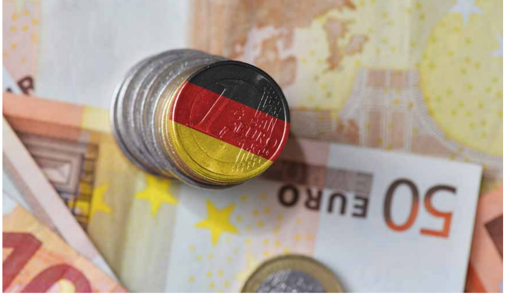
Koronavirüs salgını ile mücadele eden Almanya'da 750 milyar euro ekonomiye destek için ayrıldı.